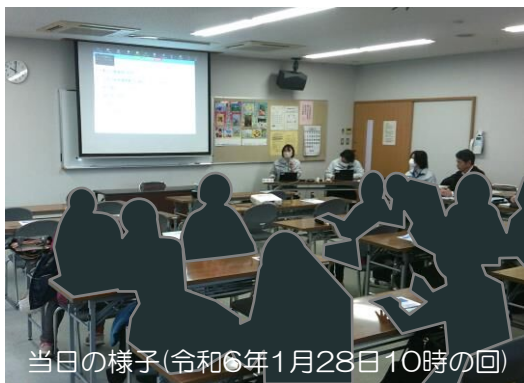
当日の様子(令和6年1月28日10時の回)